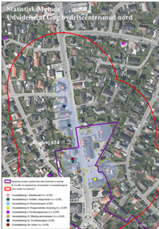
Den statistiske metodes muligheder for udvidelse af bydelsecentret i Gug (Lilla strek viser eksisterende afgrænset bydelscenter, gule cirkler er 25 m om hver produktionsenhed og rød amøbe er 100 m om faktisk bymidtekerne)