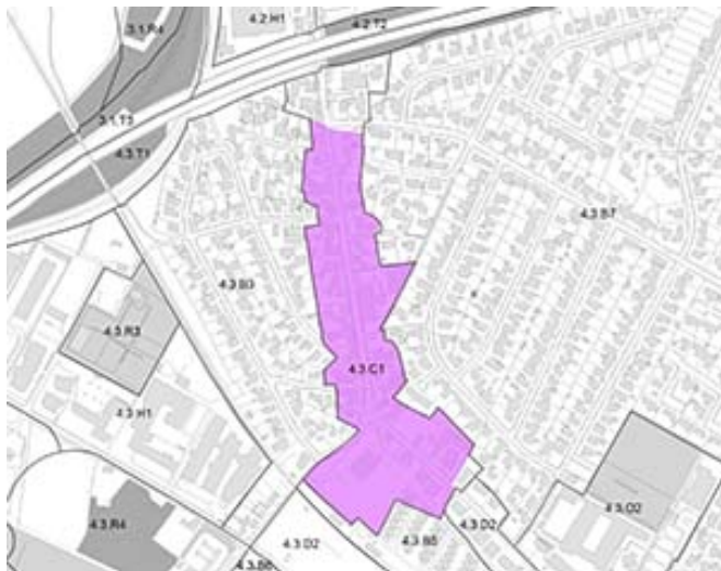
Det afgrænsede bydelscenter - Gug

Butikker* må kun placeres indenfor det afgrænsede bydelscenter, der er vist med lilla farve på nedenstående kort.