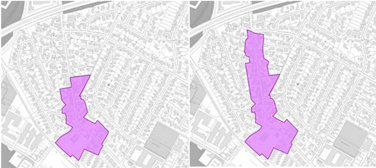
Eksisterende afgrænsning af bydelcenter Gug